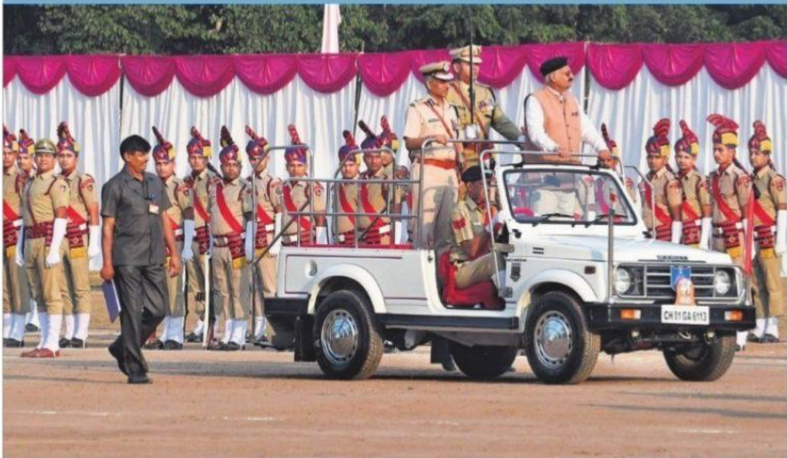
Punjab Governor and UT Administrator VP Singh Badnore inspects a parade held to mark the Raising Day of the Chandigarh Police on Thursday. It was raised after the declaration of Chandigarh as UT on November 1, 1966.