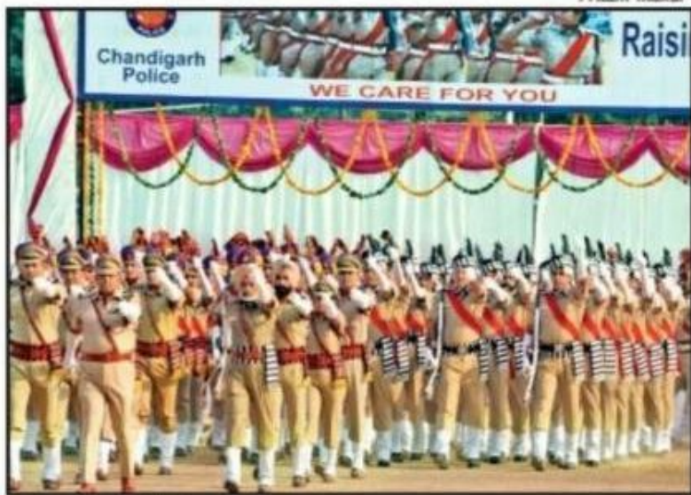
Raising Day celebrations at Police Lines in Sector 26, Chandigarh

He said police has an important role and contribution in making City Beautiful safe. Saying that police have taken steps for security of senior citizens and women, the UT administrator appreciated UT cops for their initiative of the first automated manpower place-