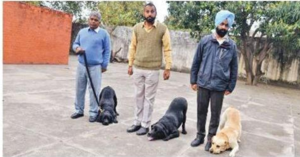
Police officials with their trained dogs.