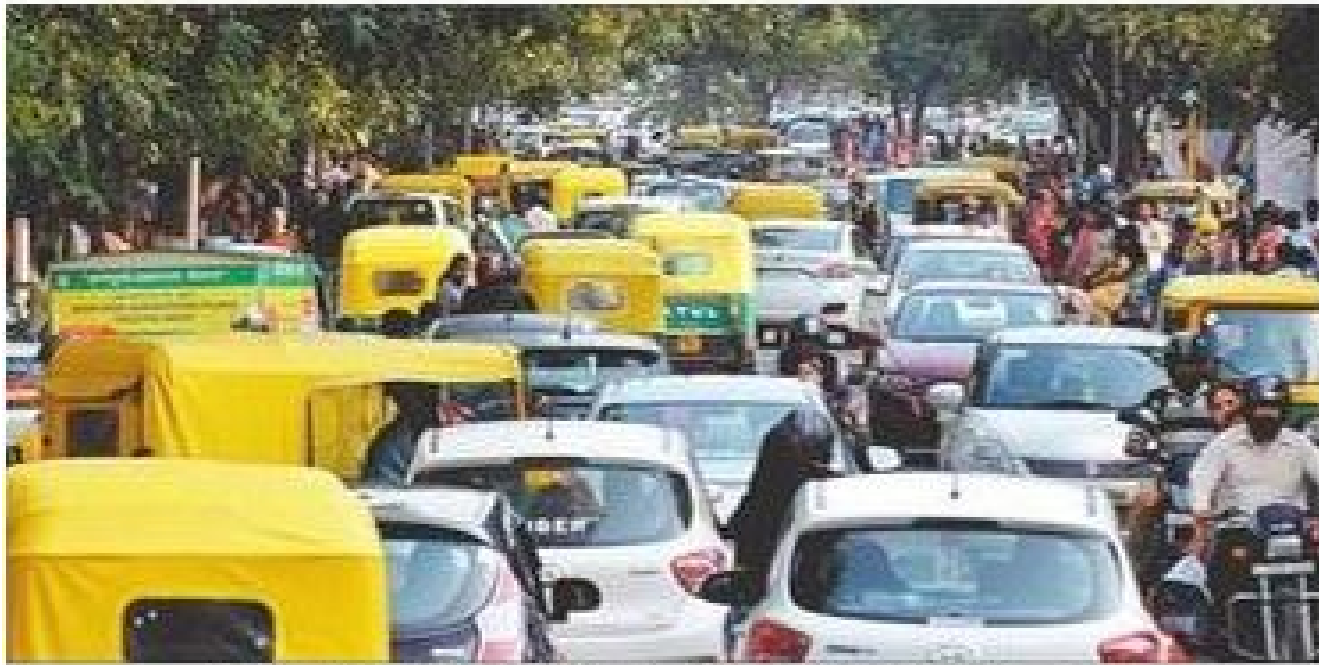
दिल्ली के केंद्रिय परिवहन सेवाएँ 16 वीं जमा जमा। वहीं लैला वैनो में कुछ टैला सडॉल नरत अरत।