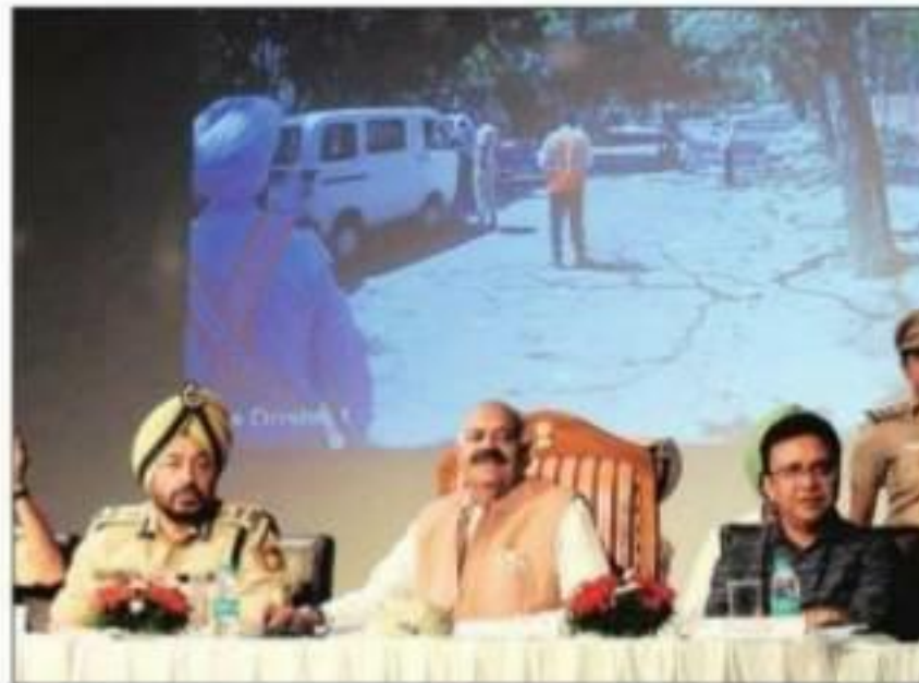
UT Administrator V P Singh Badnore with other officers after launching the app at GCG in Sector 42, Chandigarh, on Tuesday.