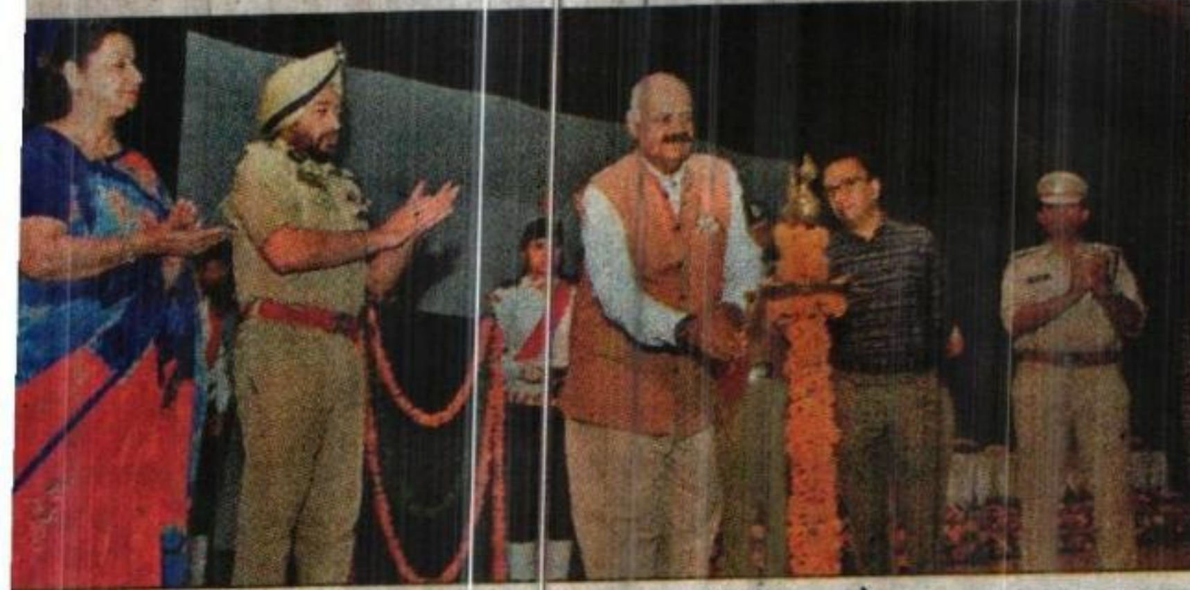
दीप प्रज्वलित कर कार्यक्रम का शुभारंभ करते प्रशासक वीपी सिंह बदनौर।