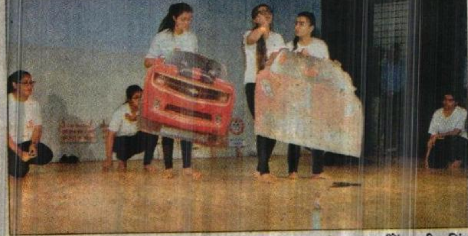
आज समाज कार्यक्रम प्रस्तुत करती कॉलेज की छात्राएं।